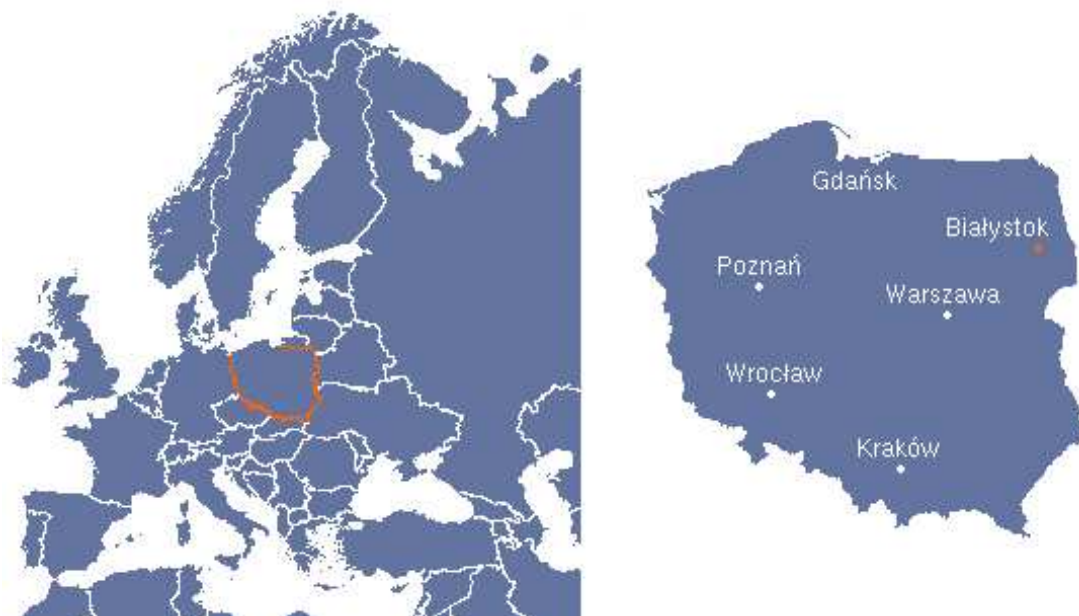
Rysunek 3.1: Polska w Europie.

Białystok 1 jest stolicą województwa podlaskiego (jednego z 16 obszarów administracyjnych) położonego w północno-wschodniej części Polski. Jest postrzegany jako europejskie miasto graniczne leżące na styku dwóch kultur: Zachodu i Wschodu. Do Warszawy - stolicy Polski jedzie się samochodem około trzech godzin, do granicy z Białorusią niecałą godzinę, zaś do Kaliningradu można dojechać w ciągu czterech godzin. Sieć drogową oraz kolejową zapewnia sprawne połączenie z resztą kraju.